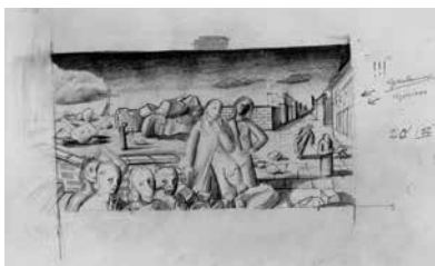
Dessin préparatoire pour le tableau Die Verdammten (Les Damnés), vers 1943, Félix Nussbaum. © Felix Nussbaum Haus/Museumsquartier Osnabrück, Allemagne.

L'avant dernière partie intitulée La Galerie du peintre présente les 6 tableaux originaux de Felix Nussbaum, dont une esquisse de sa dernière œuvre, la plus emblématique, le Triomphe de la mort . Les œuvres ont été prêtées par la Felix Nussbaum Haus, à Osnabrück. L'exposition présentera également des objets réalisés par Felix Nussbaum et un tableau de Felka Platek.