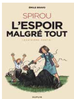
Couverture du tome 4 de l'album d'Émile Bravo Spirou. L'Espoir malgré tout © Éditions Dupuis.