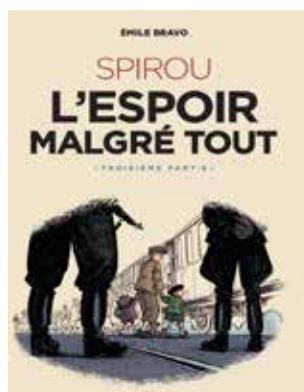
Couverture du tome 3 de l'album d'Émile Bravo Spirou. L'Espoir malgré tout © Éditions Dupuis.

Ensuite, après avoir ouvert un rideau qui nous fait symboliquement entrer dans la bande dessinée, la première partie est consacrée au Spirou d'Émile Bravo . À partir d'un entretien filmé inédit de l'auteur, d'objets familiaux lui appartenant, de plusieurs planches originales de Spirou , on en découvre plus sur la personnalité de l'auteur et son appropriation du personnage de Spirou.