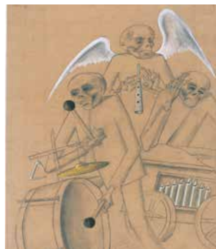
Trio formé par un joueur de tambour, un joueur d'orgue de Barbarie et un ange jouant de la flûte, vers 1944.