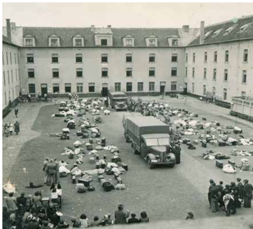
Arrivée d'un convoi à la caserne Dossin. Camp de Malines, Belgique, 1942. Malines, le lieu de départ en déportation des Juifs belges.

Le 25 novembre 1941, le commandant militaire crée l'Association des Juifs en Belgique (AJB). Ses dirigeants sont des personnalités communautaires désignées par l'occupant. La raison d'être de l'AJB est « d'activer l'émigration des Juifs », c'est-à-dire la déportation à l'Est. Les Juifs sont obligés de devenir membres de l'AJB. Le 1 décembre 1941, le commandant militaire ordonne l'exclusion des enfants juifs des écoles non juives. Le 27 mai 1942, les nazis imposent le port de l'étoile jaune en public à tous les Juifs de plus de 6 ans. Le 15 juillet 1942, le commandant du camp de Breendonk est chargé d'installer le camp de rassemblement pour Juifs dans la caserne Dossin à Malines. Du 15 août 1942 au 12 septembre 1942, la Sipo (Sicherheitspolizei « Police de sûreté ») organise six grandes rafles de Juifs. Au total, ces actions massives permettent la déportation de 4 336 Juifs à Auschwitz-Birkenau. Face aux persécutions et aux déportations qui les visent, les Juifs tentent d'échapper aux nazis par tous les moyens, parfois au péril de leur vie. Le Comité de défense des Juifs (CDJ) se forme en septembre 1942, sur l'initiative du Front de l'indépendance. Son principal instigateur, Hertz Jospa, réunit des membres, juifs et non juifs, de tous les horizons politiques, pour aider les Juifs à passer dans la clandestinité. Ce mouvement se spécialise dans le sauvetage des enfants. Yvonne Jospa met sur pied la « Section Enfance » du CDJ.