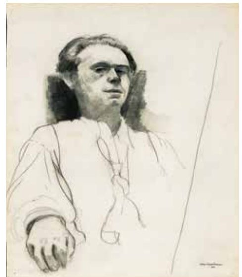
Autoportrait en contre-plongée, vers 1936, Felix Nussbaum. © Felix Nussbaum Haus/Museumsquartier Osnabrück, Allemagne.