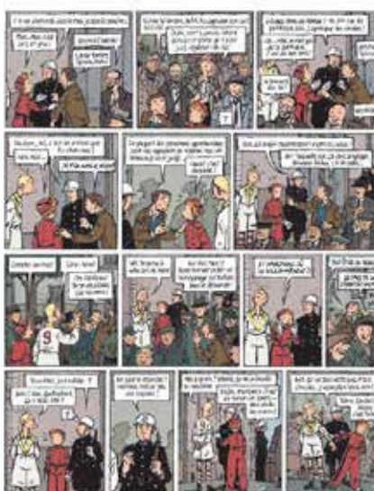
Planche du tome 1 de l'album d'Émile Bravo Spirou. L'Espoir malgré tout