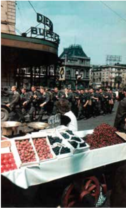
Les soldats allemands à Bruxelles, défilant devant des étals emplies de fruits et légumes. Belgique, 1940-1944.