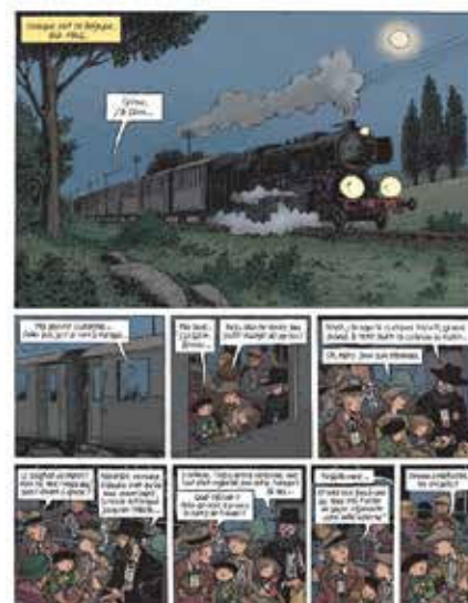
Planche du tome 3 de l'album d'Émile Bravo Spirou. L'Espoir malgré tout © Éditions Dupuis.