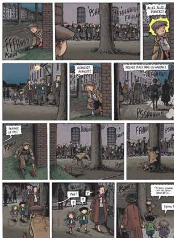
Planche issue du tome 2 de l'album d'Émile Bravo Spirou. L'Espoir malgré tout © Éditions Dupuis.