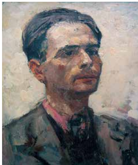
Felix Nussbaum par Sad Ji.

Felix Nussbaum, né en 1904 à Osnabrück, dans le nord de l'Allemagne, étudie les arts décoratifs à Hambourg puis les Beaux-Arts à Berlin. Il se rattache au courant de la Nouvelle Objectivité mais ses influences sont diverses : la Pittura metafisica italienne, les expressionnistes comme Otto Dix ou Max Beckmann, mais également Van Gogh et le peintre belge James Ensor qu'il rencontre lors de son exil et dont il aura le soutien. Il est à Rome quand son atelier berlinois est incendié. Il décide de ne pas rentrer en Allemagne et se réfugie en Belgique où il vit clandestinement durant l'Occupation avant d'être arrêté, puis déporté le 31 juillet 1944 à Auschwitz, sans retour.