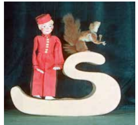
Les Marionnettes de Spirou et Spip. Belgique, sans date. À partir de décembre 1942, Spirou devient marionnette à fils. Le théâtre du Farfadet sillonne la Belgique et, tandis que ses spectacles réjouissent les lecteurs, des résistants œuvrent dans les coulisses.