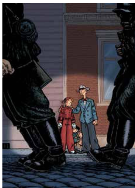
Dessin original d'Émile Bravo pour l'exposition Spirou dans la tourmente de la Shoah © Éditions Dupuis.

Exposition du 9 décembre 2022 au 30 août 2023