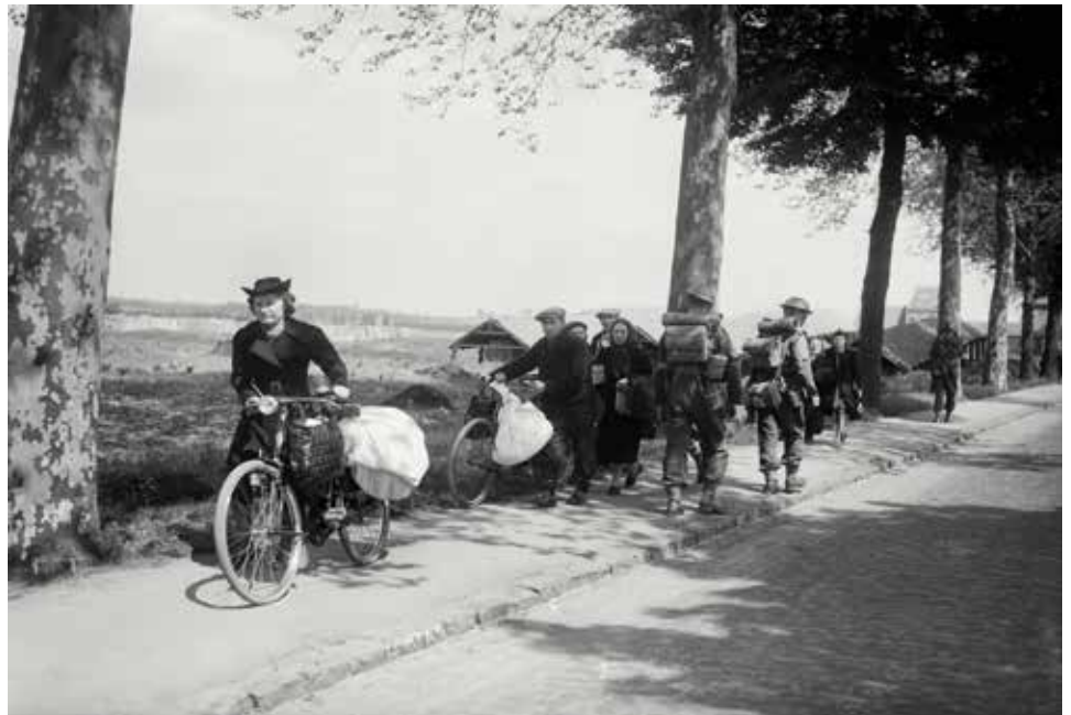
Les troupes anglaises et les réfugiés belges sur la route Bruxelles-Louvain. Belgique, 1940.

Le 10 mai 1940, les troupes allemandes envahissent le pays. Se souvenant des massacres de civils d'août 1914, des millions de Belges prennent la fuite dans la désorganisation la plus totale. Le gouvernement quitte Bruxelles le 17 mai. Le pouvoir est confié à un collège de secrétaires généraux, les plus hauts fonctionnaires de l'administration, qui deviendront les interlocuteurs de l'occupant. L'armée belge n'est pas de taille. Après dix-huit jours de combat, le roi capitule, en désaccord avec le gouvernement. C'est le début de l'Occupation. Dès le 20 mai, le général von Falkenhausen est nommé gouverneur de toute la Belgique et, le 1 juin, on lui ajoute le nord de la France (Nord et Pas-de-Calais). Un commandement militaire se met en place: le MBB – Militärbefehlshaber in Belgien und Nordfrankreich . Avec ses cinq Oberfeldkommandantur (OFK) réparties géographiquement à Bruxelles – la capitale –, Gand, Liège, Mons et Lille, le MBB peut tenir les objectifs de Berlin. Il fait preuve de pragmatisme et de réalisme pour orchestrer avec les services policiers nazis – aidés par les polices belges et les collaborateurs – l'administration civile, la répression de la Résistance et les déportations des Juifs de Belgique et du nord de la France.