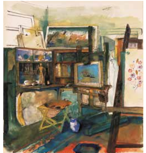
Felix Nussbaum, Atelier à Bruxelles, 1940. Aquarelle.