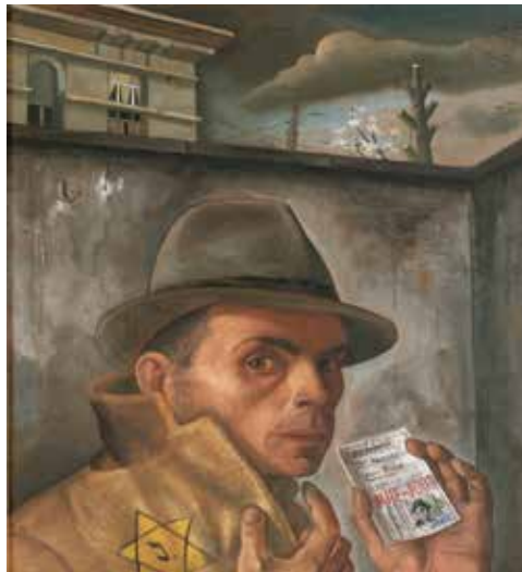
Felix Nussbaum, Autoportrait au passeport juif. Belgique, vers 1943.