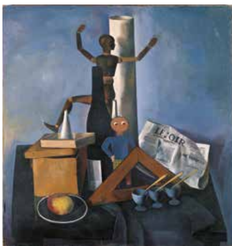
Felix Nussbaum, Nature morte au mannequin. Belgique, vers 1942. Huile sur toile.

Avec 27 tableaux, la Felix-Nussbaum-Haus possède également la plus grande collection d'œuvres de Felka Platek au monde.