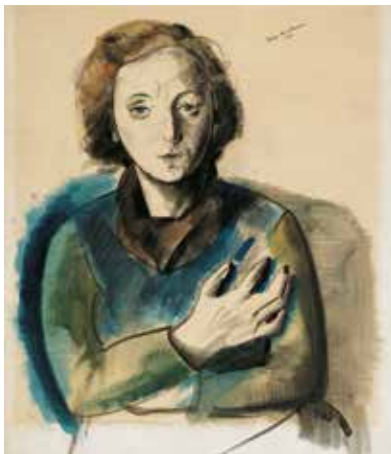
Felix Nussbaum, Portrait de Felka Platek avec les bras croisés, 1940. Gouache et fusain sur papier. © Felix Nussbaum Haus/Museumsquartier Osnabrück, Allemagne.