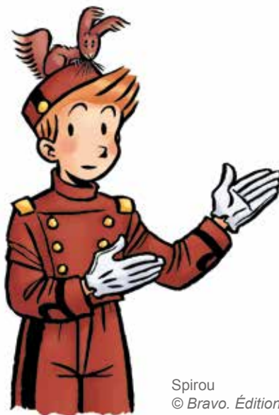
Spirou © Bravo. Éditions Dupuis.

Un parcours famille a été conçu spécialement et il est visuellement présent tout au long de l'exposition grâce à une signalétique inspirée du personnage de Spirou. Il est accompagné d'un livret de 16 pages en libre-service à l'entrée de l'exposition.