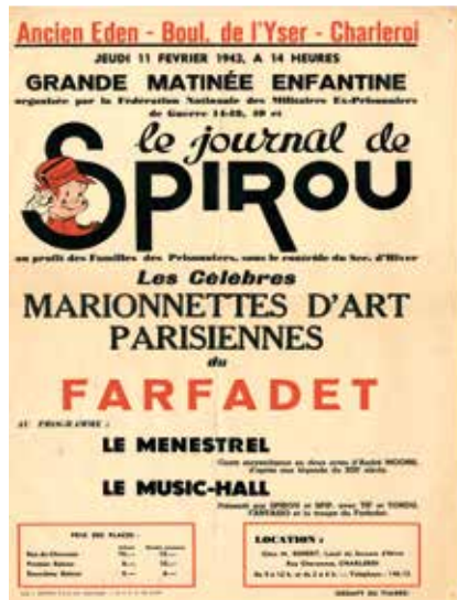
Une affiche d'un spectacle du théâtre du Farfadet. Belgique, février 1942.