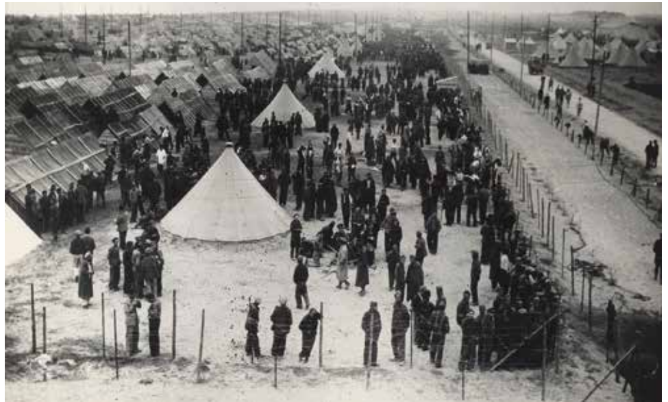
Réfugiés espagnols au camp de Saint-Cyprien. France, Pyrénées-Orientales, 1939.

Les hommes sont dirigés vers le camp de Saint-Cyprien, alors que les femmes vont au camp de Gurs. 7 500 réfugiés arrivent à Saint-Cyprien, les autres ayant été rattrapés par l'avancée des troupes allemandes qui envahissent la France en mai 1940. Les conditions d'internement sont très mauvaises. Au total, près de 40 000 « indésirables » arrêtés en France et en Belgique sont internés en France à la fin de la III e République et lors des offensives éclair de l'armée allemande.