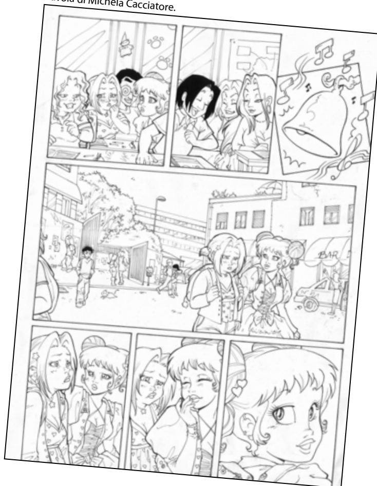
Tavola di Michela Cacciatore.

In anteprima dal 2 al 5 ottobre 2008 a Romics (nuova Fiera di Roma).